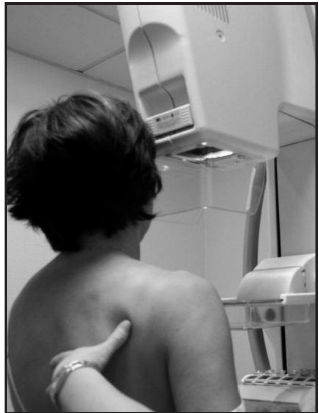
Réalisation d'une mammographie

Elle qui déclare n'être jamais allée défilier pour quelque motif que ce soit, se dit prête à manifester, au cas où... ▶